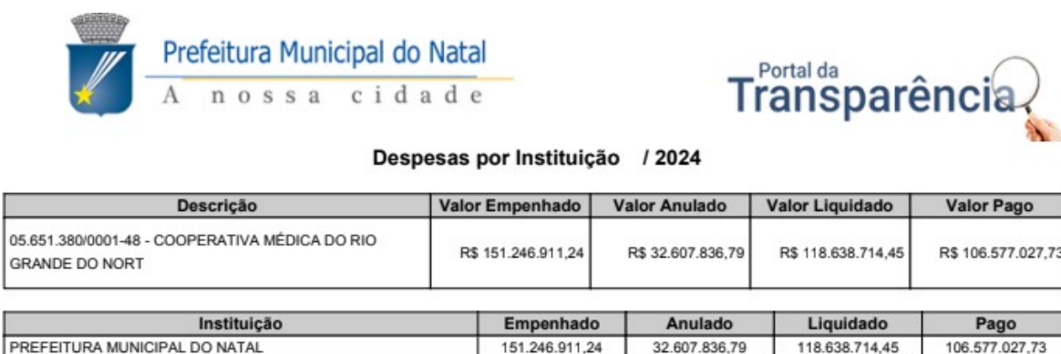
Imagem 01: Despesas com cooperativa médica